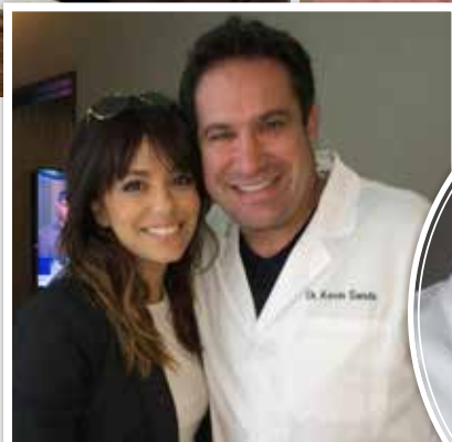
Ева Лонгория регулярно навещает к доктору Сэндзу — для профилактики